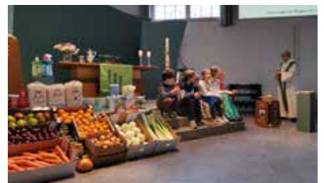
Het kindermoment tijdens de oogstdienst