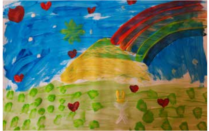
Geschilderd door de tienergespreksgroep

En alle, alle mensen samen, die zullen voor Gods aangezicht staan zingen in het grote licht. En God kent allen bij hun namen. (Lied 448)